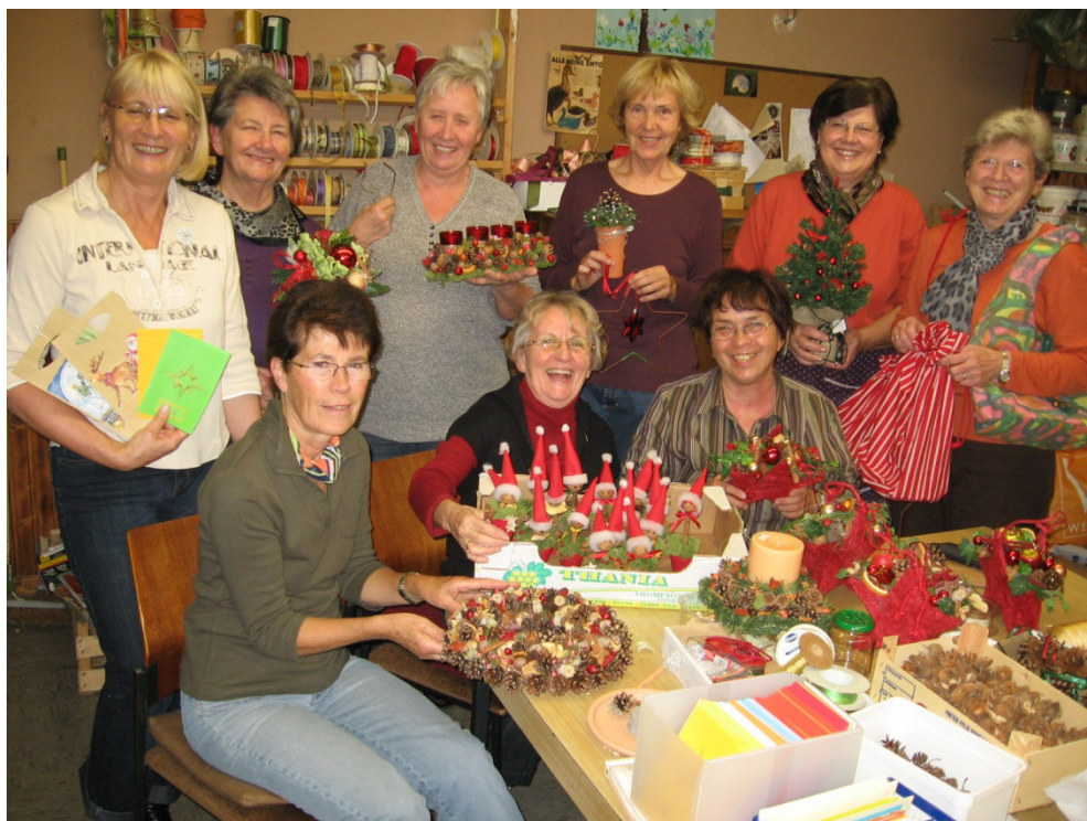
Ein Teil der „Bastelmädels“ bei der Arbeit