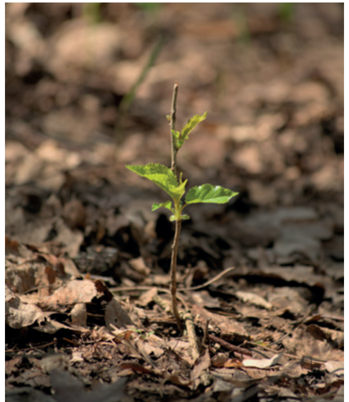
Zukunft wächst – von Gott getragen.