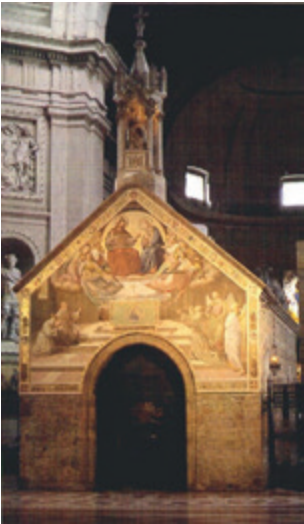
Das Kirchlein von Potiuncula, heute in die Kirche Sta. Maria degli Angeli integriert